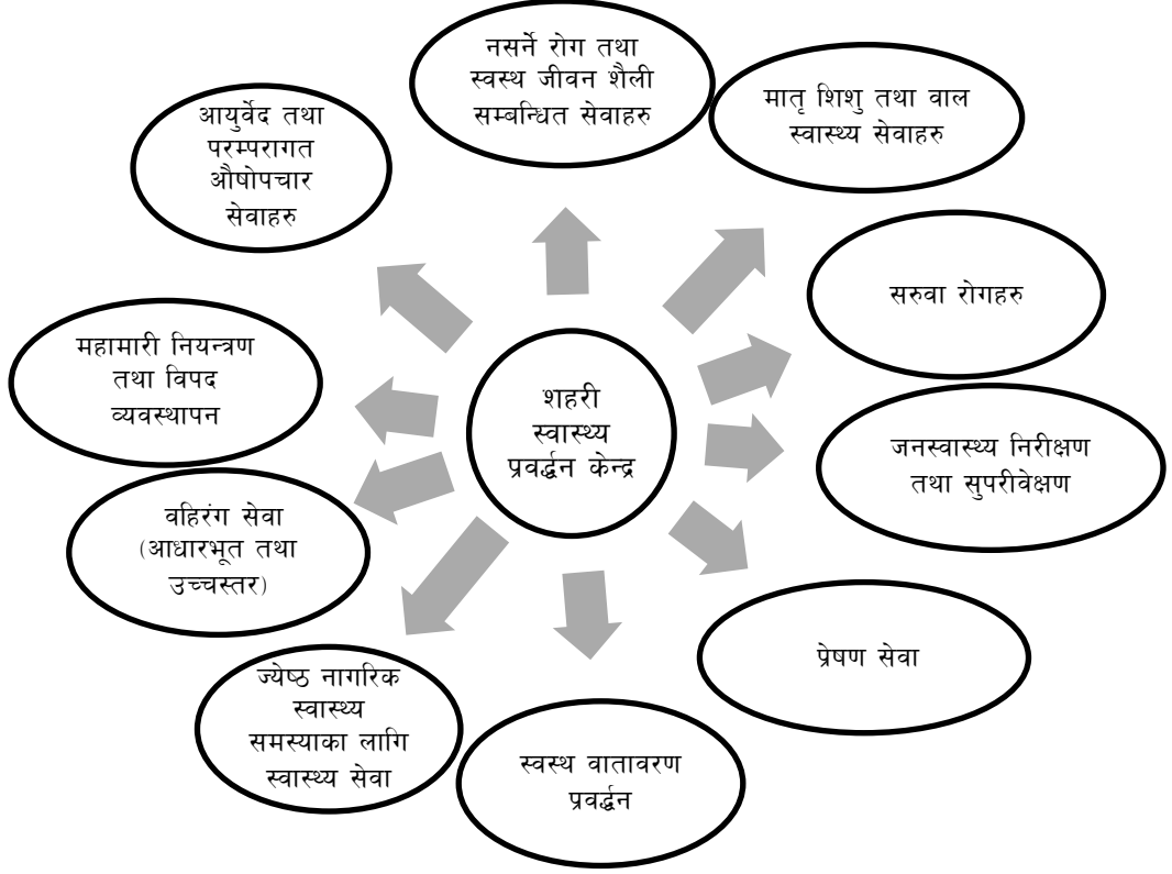
चित्र-१ . शहरी स्वास्थ्य प्रवर्द्धन केन्द्रका मुख्य सेवा घटकहरु

शहरी स्वास्थ्य प्रवर्धन केन्द्रले मुख्य: रुपमा देहाय बमोजिम दश प्रकारका सेवा घटकहरु अन्तरगत विभिन्न स्वास्थ्य सेवाहरु प्रदान गर्नेछ।